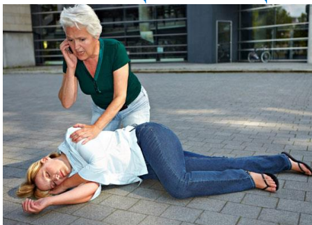
Рис. Безопасное положение пострадавшего при инсульте

Если инсульт случился на улице, оказание первой помощи имеет такие особенности: